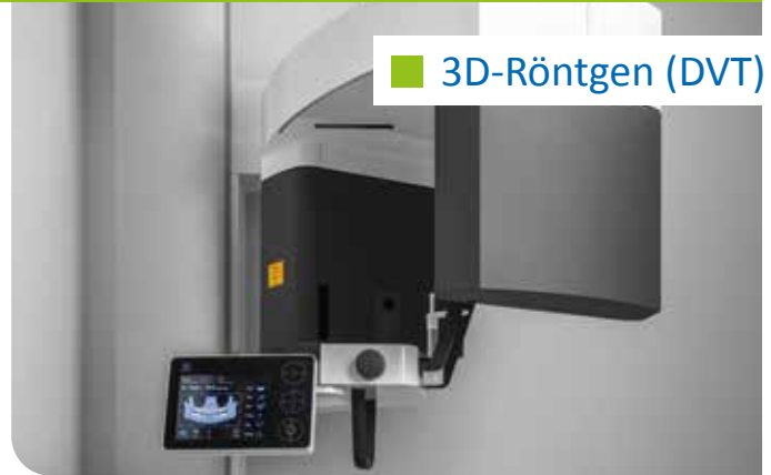
■ 3D-Röntgen (DVT)